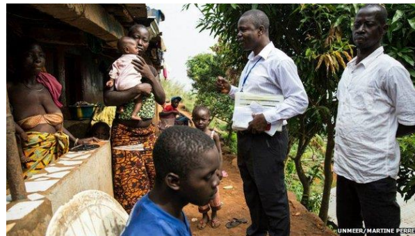
KUVIO 1. VIRANOMAISET OVAT ALOITTANEET TALOSTA TALOON KIERTÄMISEN FREETOWNISSA.

Hallituksen joulukuun puolivälissä julkista-